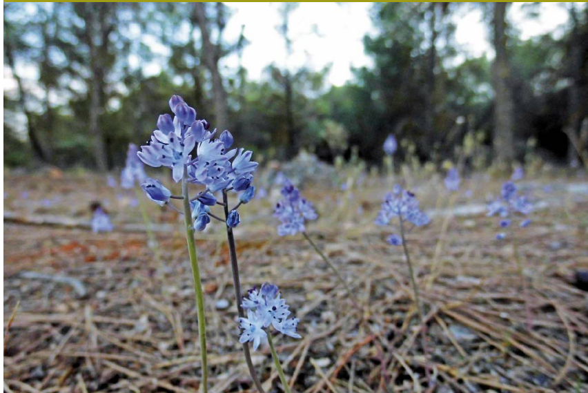
La densa sombra de los bosques de pinos carrascos apenas deja lugar a las flores, como este humilde bulbito que ha buscado el lindero

Por último, y sin entrar a describir todavía la gran laguna malagueña, son muy numerosos los pozos excavados con fines agrícolas en la parte final de la ruta, en la zona de Las Albinas, un topónimo que tiene que ver con el encharcamiento temporal del terreno.