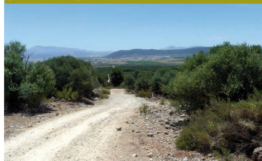
El camino es casi todo una pista forestal que transita por entre olivares y tierras de secano

La gran protagonista del recorrido en cuanto al agua es la propia sierra, aparentemente seca pero que guarda en su interior el secreto de cuantos nacimientos la rodean, el más importante el del Arroyo Santillán. Son muy numerosas las cavidades exploradas en la mole caliza, testigos de esa circulación subterránea retardada y encauzada por la carstificación del terreno. Cabe destacar la Cueva de los Órganos por su extensión, la Sima del Soldado por su profundidad o la de las Goteras. Otras son solamente abrigos, menos importantes desde el punto de