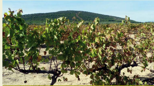
La Sierra de la Camorra o de Mollina vista desde un viñedo cercano

Hay varias opciones cercanas al sendero. La llamada Ruta Roja comienza en el Cortijo de la Capuchina, en el puerto de la etapa, y finaliza en el vértice geodésico de la montaña tras unos 6 kilómetros de recorrido. La riqueza en cuevas de la zona es proverbial, y en este sendero se ven algunas de las más importantes, incluido el Abrigo de los Porqueros.