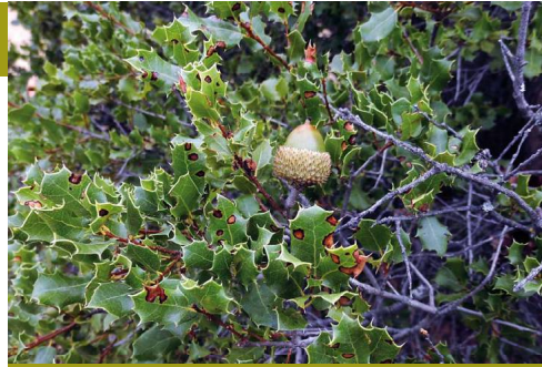
La coscoja es uno de los arbustos nobles que prosperan bajo el pinar o en los matorrales sobre calizas

Y el agua que penetra en la sierra debe salir en cuanto las condiciones geológicas del terreno por el que circula, debido a su impermeabilidad y orientación, la empuje fuera de la roca madre. Esto es lo que ocurre en el nacimiento del Arroyo Santillán, en la linde entre los términos municipales de Mollina y Fuente de Piedra. La propia sierra genera la circulación de numerosos arroyuelos que radialmente parten desde ella hacia el sur, como los de Berdún, Aceiteros o el propio Santillán, el de mayor caudal. El sendero acompaña al arroyuelo desde su nacimiento hasta prácticamente la desembocadura en la laguna por su extremo norte.