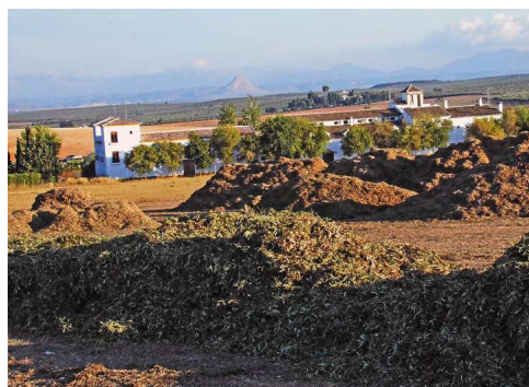
Restos vegetales provenientes de la recogida de aceitunas en las cercanías de un cortijo

Cuando se pasa por el Área Recreativa en el kilómetro 9 el sentido de la marcha es francamente oeste y el terreno se vuelve llano. Aunque hay manchas de olivar, el secano es el que toma fuerza. Ahora el sendero tiene que pasar secuencialmente por diversas infraestructuras, alguna, como la del AVE, de primer orden a nivel nacional. Esto es en el kilómetro 10. En el 12.3 es la carretera MA-701 la que hay que cruzar con precaución y